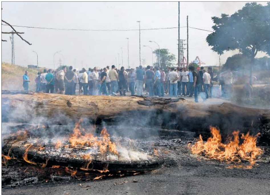
Una barricada ardiendo con neumáticos y troncos de árboles junto a la factoría de Astilleros en Sevilla.