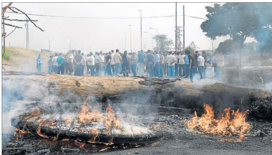
ASTILLEROS, COMO CASI SIEMPRE. Los trabajadores de la factoría de Astilleros de Sevilla volvieron ayer a las protestas formando una barricada con neumáticos y troncos de árboles con la que cortaron la carretera. Reclaman a la Junta soluciones de viabilidad para la fábrica.

Desde la Comisión Europea se asegura que no es una propuesta concreta, sino un análisis de datos en el contexto de un documento de reflexión. Además, añaden, «la Co-