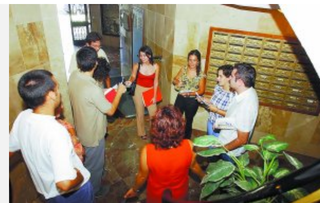
Vecinos de una comunidad de propietarios debaten en una reunión si llevan a los tribunales a un residente moroso.

Mientras, en algunas comunidades de vecinos donde los impagos están a la orden del día se viven situaciones