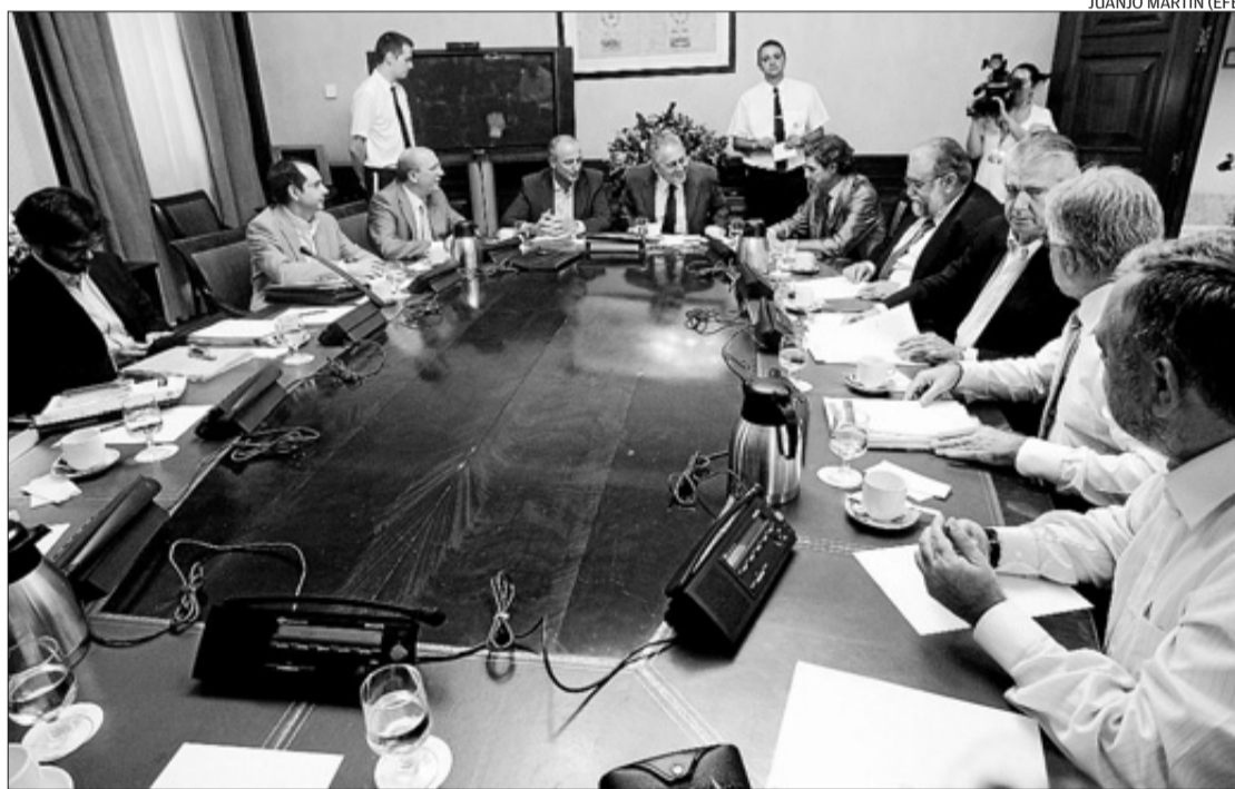
JUANJO MARTÍN (EFE)

► EL GOBIERNO HABLA DE «SOBRECAPACIDAD». El ministro de Industria, Turismo y Comercio, Miguel Sebastián, consideró ayer que «difícilmente tiene cabida» una nueva central nuclear en España, ya que existe una «sobrecapacidad» de generación en el sistema y, por ello, «el traje eléctrico es muy grande». Tras comparecer ante la subcomisión del Congreso de los Diputados sobre la estrategia energética para los próximos 25 años, el ministro respondió a las informaciones acerca de la posibilidad de que la gran industria construya dos nucleares en los terrenos de la central de Zorita, algo que calificó de «chismorreos».