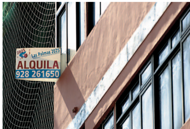
Oferta de alquiler en Las Palmas de Gran Canaria.

Alquilar una habitación es como vivir como en tu propia casa. La pérdida de poder adquisitivo de los canarios empieza a forzar cambios en el mercado inmobiliario. Una de las respuestas es ceder dormitorios para que estudiantes, inmigrantes o trabajadores mileuristas los ocupen. En uno de los meses que por tradición registran mayor movimiento debido al inicio del curso académico, "el alquiler se incrementa de forma muy notable", explican desde la Asociación para el Fomento del Alquiler (Arrenta), que advierte de un aumento de la oferta de pisos en régimen de alquiler de casi el 100% en esa época. "La demanda existente demuestra que se generaliza la fór-