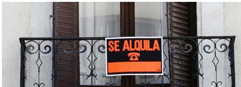
Cartel de 'Se alquila' en un balcón.

0 votos Comentarios | Comparte esta noticia »