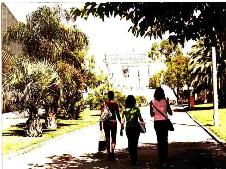
Los estudiantes universitarios son los potenciales clientes de los pisos para compartir. MANUEL MOLINES

El precio medio de una habitación alquilada en un piso compartido en la ciudad de Valencia durante el pasado mes fue de 247 euros y las personas