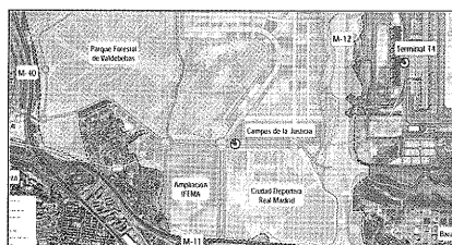
Plano del Parque de Valdebebas.

Pryconsa construirá 264 viviendas en el Parque de Valdebebas . Serán 174 viviendas libres, 60 viviendas protegidas de precio básico y 30 de precio limitado. Las parcelas donde se levantarán los desarrollos suman una edificabilidad residencial superior a los 26.000 metros 2 . Con esta adquisición, el Grupo Pryconsa incrementa su presencia en Valdebebas hasta un total de 633 viviendas, lo que significa que de las 12.500 viviendas que se construirán en el complejo, una de cada 20 de ellas corresponderá a una promoción perteneciente a la compañía.