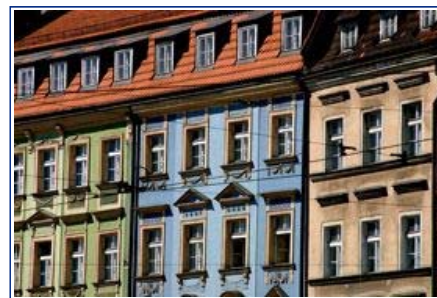
Una normativa para salir de la crisis.